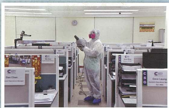
穿著全套保護衣物的清潔同事正為城市服務集團總寫字樓進行噴霧消毒。

在過去半年，新型冠狀病毒於全球多個地方蔓延，對各行各業造成重大打擊。城市服務集團的正常運作亦受到前所未有的挑戰，要在維持集團正常運作的同時做好防疫的措施，如何搜羅裝備、安排適切的清潔措施以確保集團員工能在安全的環境下工作成為了最重要的工作。