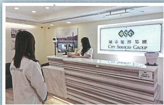
總寫字樓使用自動體溫探測系統為員工量度體溫。

早在一月底香港疫情未有重大爆發時，集團採購部同事已向世界各地不同的供應商採購防疫用品，如消毒搓手液、外科口罩、保護衣、體溫計等。疫症爆發初期，各樣防疫物資價格高昂，即使如此，為保障同事安全，集團仍以最快速度，不惜工本地為員工採購防疫用品。而一系列的防疫制度如外遊申報機制、彈性上班時間及強制體溫量度等，亦早在疫症初期已開始執行，務求為全體集團同事提供全面的防疫保護。